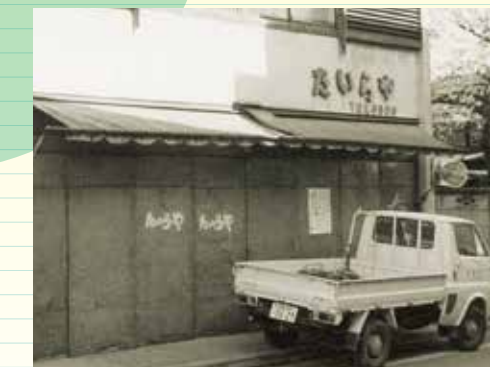
行商の経験を生かし自らの手でスーパーマーケットの原型ともいえる青果店、112坪の「たいらいや」をオープン。「人生で一番感動した瞬間」