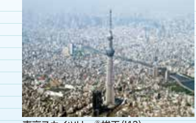
東京スカイツリー「竣工」('12)