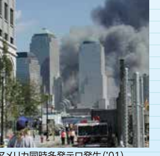
アメリカ同時多発テロ発生('01)