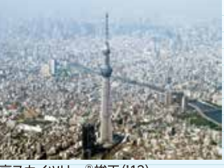
東京スカイツリー「竣工」('12)