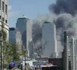
アメリカ同時多発テロ発生('01)