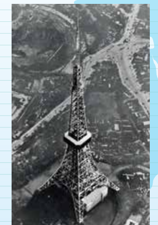
東京タワー公開('58)