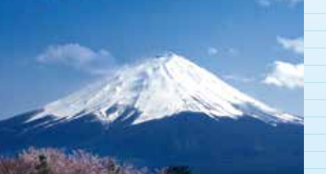
富士山が世界文化遺産に登録 ('13)