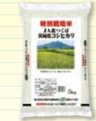
特別栽培米コシヒカリ(エコス米)の販売('02.10月)