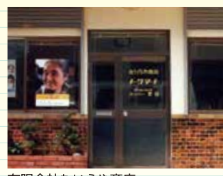
有限会社たいらや商店