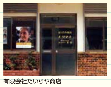
有限会社たいらや商店