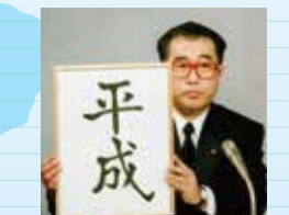
昭和から平成へ ('89)