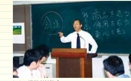
セルコ経営者勉強会

環境活動の歩み 1997年(平成9年) 8月 エコ・ショップ(地球にやさしいお店)認定取得開始