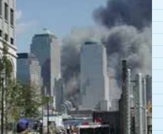
アメリカ同時多発テロ発生 ('01)