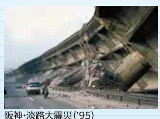
阪神・淡路大震災 ('95)