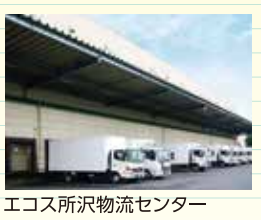
エコス所沢物流センター

環境活動の歩み 2005年(平成17年) 5月 エコス特別栽培米田植えツアー開始 9月 エコス特別栽培米福刈ツアー開始 9月 循環型農業による契約栽培野菜販売スタート