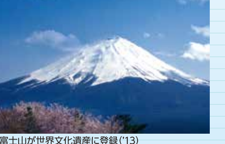
富士山が世界文化遺産に登録('13)