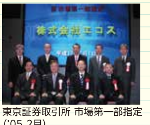
東京証券取引所 市場第一部指定('05.2月)

環境活動の歩み 2004年(平成16年) 7月 従業員の制服全種類をエコ素材使用にリニューアル