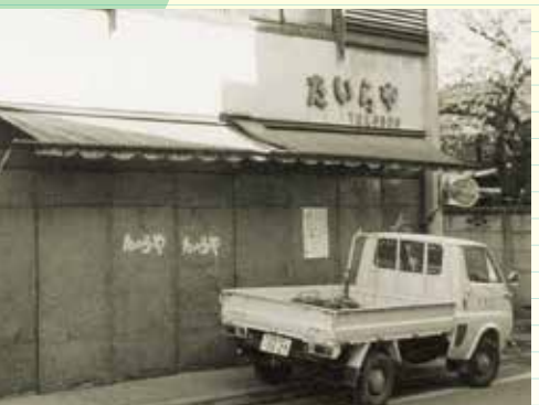
行商の経験を生かし自らの手でスーパーマーケットの原型ともいえる青果店、112坪の「たいらいや」をオープン。「人生で一番感動した瞬間」