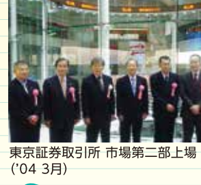
東京証券取引所 市場第二部上場('04.3月)

環境活動の歩み 2003年(平成15年) 3月 エコス環境レポート創刊 8月 ペットボトルの店頭回収を全店で開始