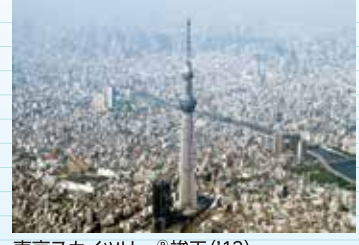
東京スカイツリー「竣工」('12)