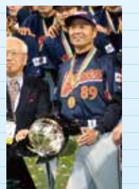
第1回WBC優勝('06)