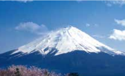
富士山が世界文化遺産に登録('13)