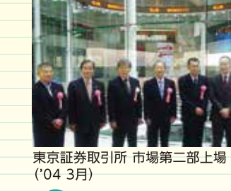
東京証券取引所市場第二部上場('04.3月)

2003年(平成15年) 3月 エコス環境レポート創刊 8月 ペットボトルの店頭回収を全店で開始