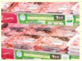
食品リサイクルグループにより肥育した「旨香豚(うまかぶた)」

環境活動の歩み 2008年(平成20年) 1月 食品トレーを使わないお肉売場の展開開始 4月 産・官・学協同による「バイオマス活用推進エコスマニュアル」の完成