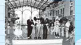
東京ディズニーランド開園 ('83)