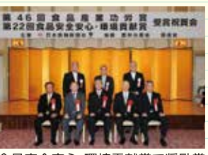
食品安全安心・環境貢献賞で奨励賞を受賞('13.11月)

環境活動の歩み 2008年(平成20年) 1月 食品トレーを使わないお肉売場の展開開始 4月 産・官・学協同による「バイオマス活用推進エコスマニュアル」の完成